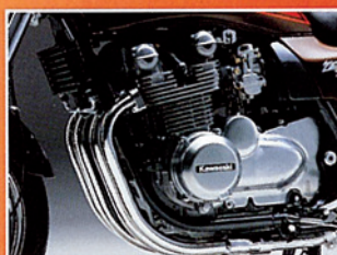
Durchzugsstark: der luftgekühlte Vierzylinder-Reihenmotor.

Fahrspaß auf kurvigen Landstraßen: Die Telegabel vorne und die einstellbare Federung mit Ausgleichsbehälter an der Doppelarm-Schwinge hinten garantieren Fahrkomfort und Sicherheit. Mit dem verwindungssteifen Doppelschleifen-Rohrrahmen ist die Zephyr 1100 stabil und sicher zu handhaben.